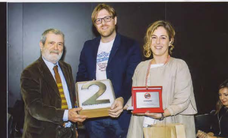
GIOPATO & COOMBES PER LA POLTRONA KIRU DI LIVING DIVANI